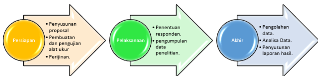
Skema 1 Tahap Penelitian